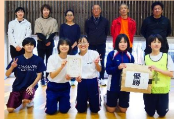
ペプシ高良チーム