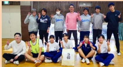
チョコレートディスコチーム