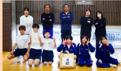
ボール職人チーム