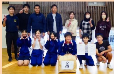
レイパーズチーム