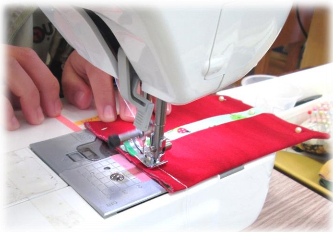
ミシン縫い(中縫い)