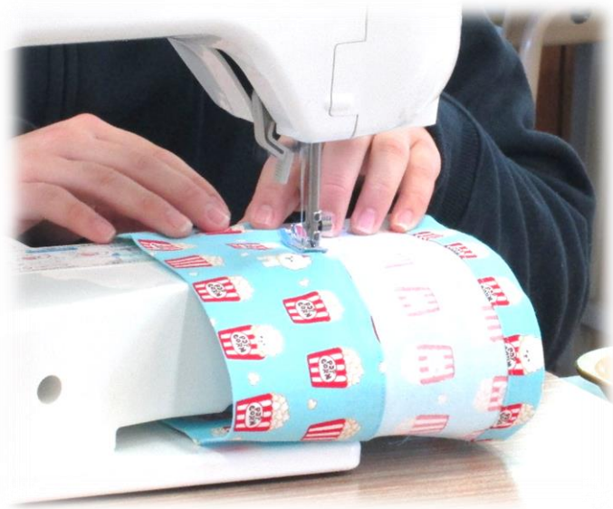
ミシン縫い(仕上げ縫い)