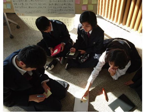
[インタビューの作戦を立てる]