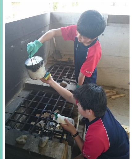
[飯ごうでお米を炊く]