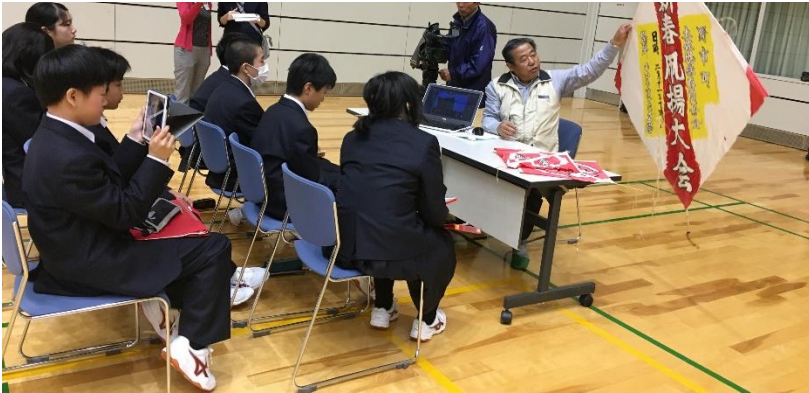
[講師から説明を聞く]

本番では、グループで事前に決めていた「魅力×〇〇（各班のテーマ）」を柱に質問。複数回のインタビューの合間には、iPadでの録画を見て振り返り、次のインタビューの改善につなげました。