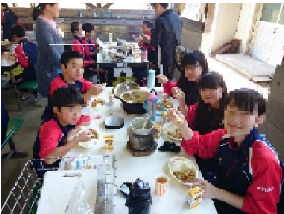
[出来上がったカレーを食べる]

今回の研修のテーマは「共に活動！共に楽しむ！二泊三日の宿泊研修」でした。三日間天気にも恵まれ、ほとんど予定通り活動できたことは大変喜ばしいことでした。二日目のインタビュー活動では時間がない中、精一杯質問を考え、中間発表では大変すばらしい発表となりました。今回の研修で築いた絆、学んだことをこれからの生活に生かしていきたいと思ひます。