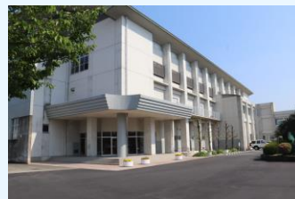
正門から見た体育館