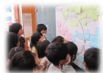
▲探究の様子 (大宮小学校)

ぜひ、大宮小学校のホームページ( https://www.fureai-cloud.jp/omiya-e/ )をご覧ください。