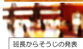
班長からそうじの発表