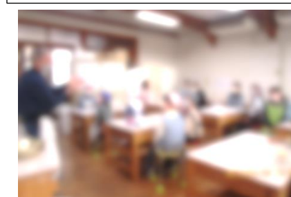
5年：デンマーク料理