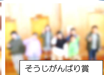
そうじがんばり賞