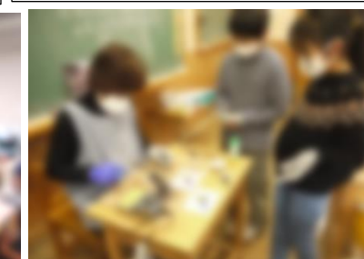
6年：ステンドグラス

バルーンアートをしました。さいしょにきりんをつくりました。ほんとうは、きりんのくびはながくつからないといけないのに、みじかくなりました。もう1回つくってみると、ながくなって上ずことができました。つぎに花かざりをつくりました。すこしむずかしかったけどたのしかったです。1回だけわれて大きなおとがしました。2年