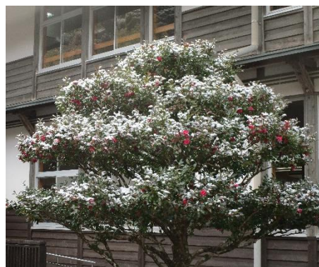
積もるなごり雪 春遠からじ