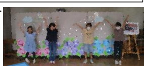
ハツバメダンス：2年生