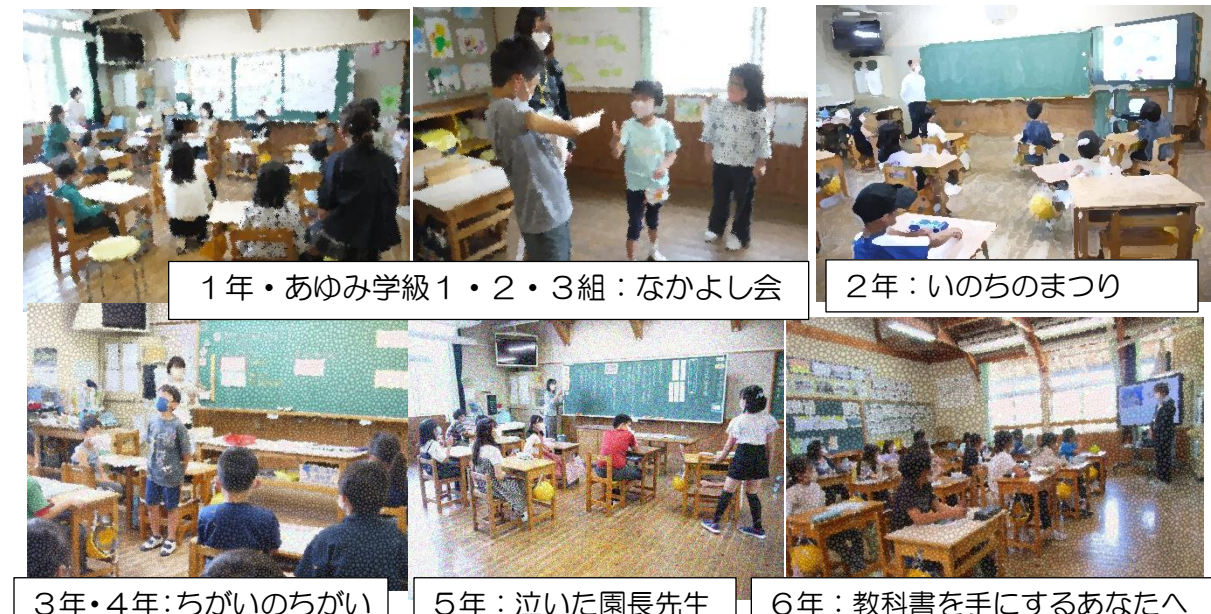
1年・あゆみ学級1・2・3組：なかよし会

第2回目の参観日は年に1度の人権参観日でした。各クラス人権教育の視点に立って教材を選び授業を行いました。お忙しい平日開催にもかかわらず、その上コロナ対策に協力いただきのご参加ありがとうございました。また、PTA 人権研修会では「子どもを真ん中に位置付けてつながろう。」とする保護者の皆さんの輪(和)が見えました。詳細はPTA からののお便りをご覧ください。