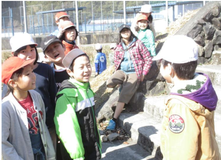
ファミリー班でお弁当。みんなで楽しく遊んだ後のお弁当はとってもおいしかったです。