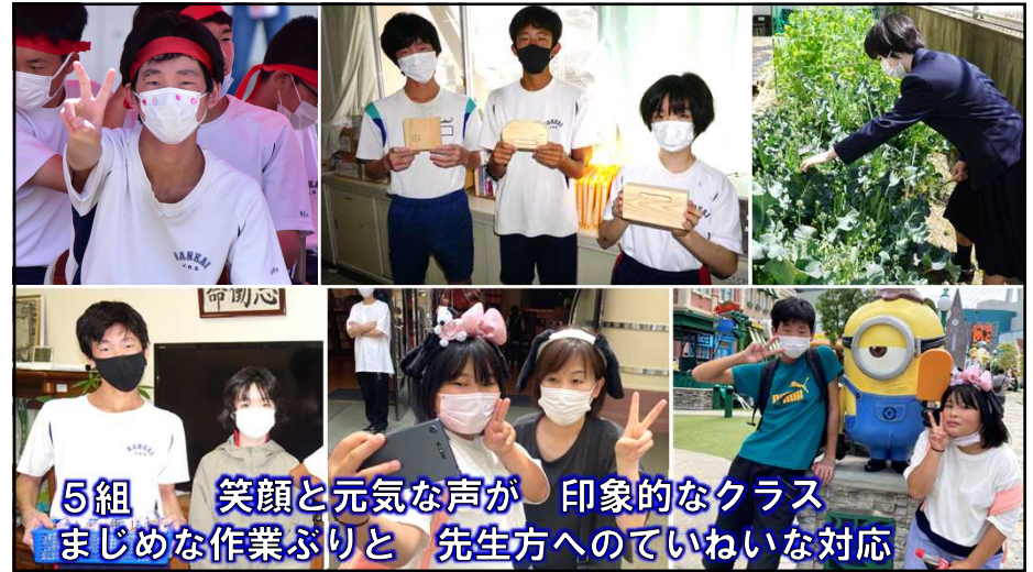
5組 笑顔と元気な声が 印象的なクラス まじめな作業ぶりと 先生方へのていねいな対応