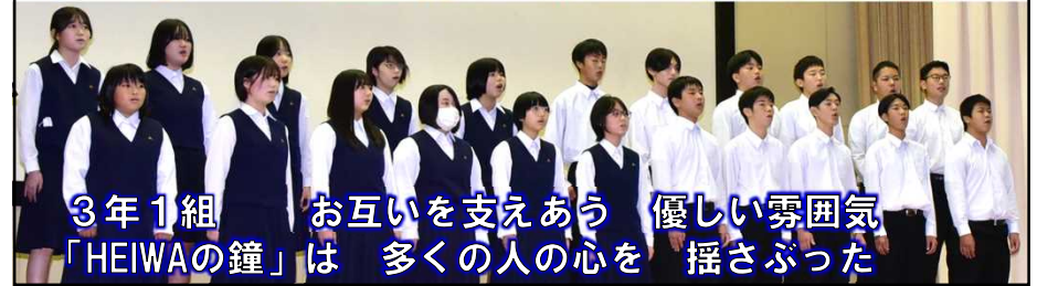
3年1組 お互いを支えあう 優しい雰囲気 「HEIWAの鐘」は 多くの人の心を 揺さぶった