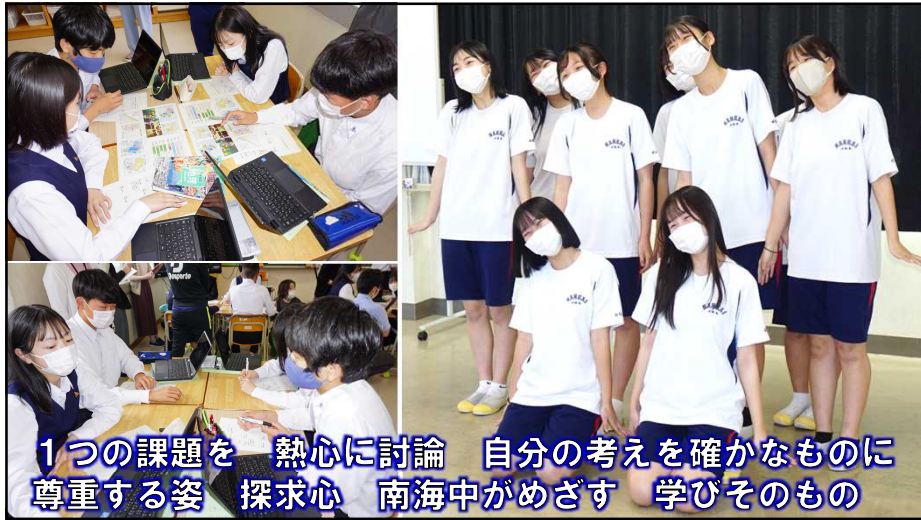
1つの課題を 熱心に討論 自分の考えを確かなものに 尊重する姿 探求心 南海中がめざす 学びそのもの