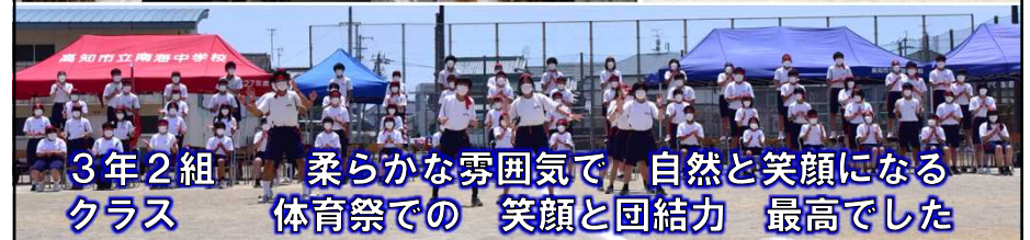
3年2組 柔らかな雰囲気 自然と笑顔になる クラス 体育祭での 笑顔と団結力 最高でした