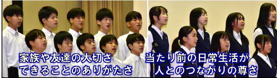
家族や友達の大切さ できることのありがたさ 当たり前が日常生活が 人とのつながりの尊さ