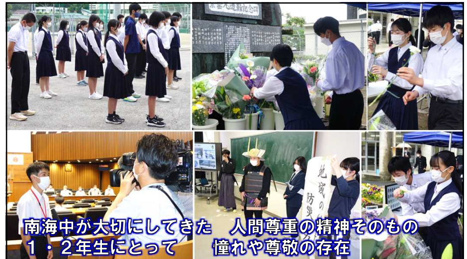
南海中が大切にしてきた 人間尊重の精神そのもの 1・2年生にとって 憧れや尊敬の存在