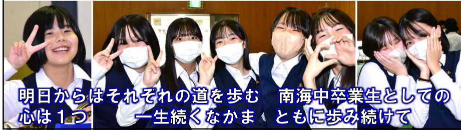
明日からはそれぞれの道を歩む 南海中卒業生としての 心は1つ 一生続くなかま ともに歩み続けて