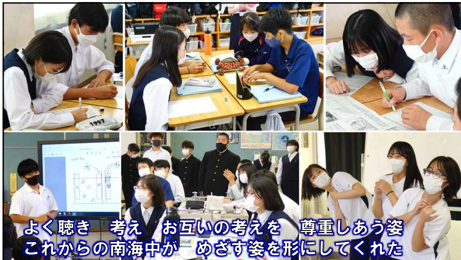
よく聴き 考え お互いの考えを 尊重しあう姿 これからの南海中が めざす姿を形にしてくれた