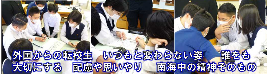
外国からの転校生 いつもと変わらない姿 誰をも 大切にする 配慮や思いやり 南海中の精神そのもの