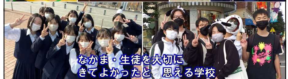
なかま・生徒を大切に きてよかったと 思える学校