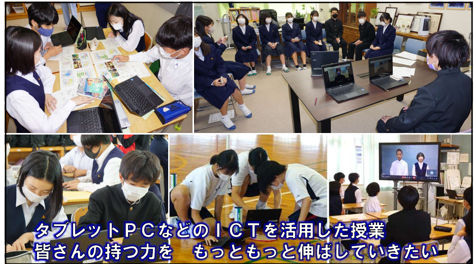
タブレットPCなどのICTを活用した授業 皆さんの持つ力を もっともっと伸ばしていきたい