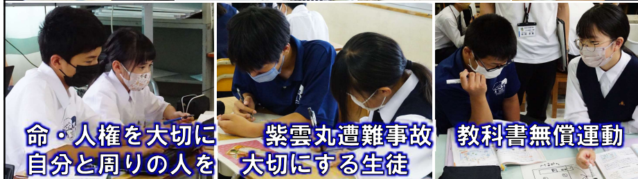
命・人権を大切に 自分と周りの人を 紫雲丸遭難事故 大切にす生徒 教科書無償運動