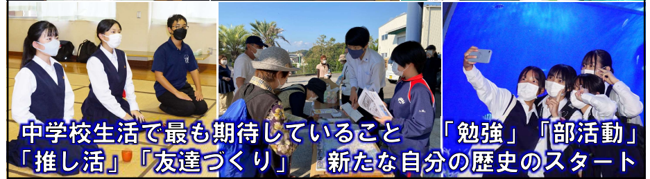
中学校生活で最も期待していること 「勉強」「部活動」「推し活」「友達づくり」 新たな自分の歴史のスタート