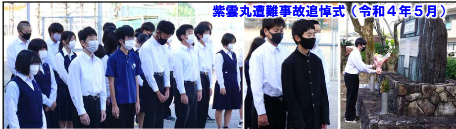
紫雲丸遭難事故追悼式 (令和4年5月)