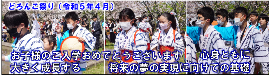
どろんご祭り（令和5年4月）