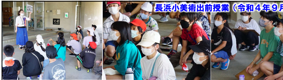
長浜小美術出前授業（令和4年9月）