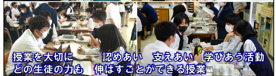
授業を大切に 認めあい 支えあい 学びあう活動 どの生徒の力も 伸ばすことができる授業