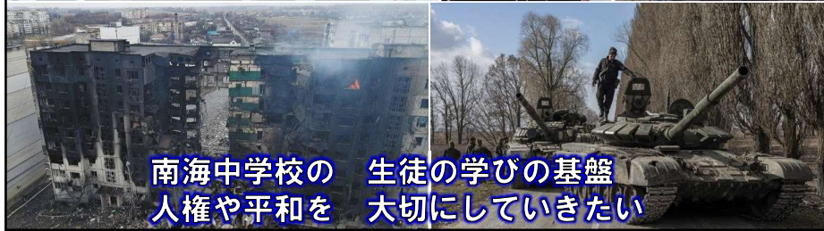
南海中学校の 生徒の学びの基盤 人権や平和を 大切にしていきたい