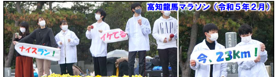
高知龍馬マラソン（令和5年2月）