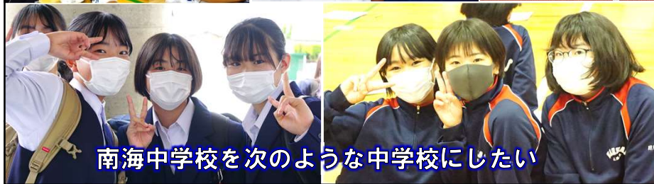
南海中学校を次のような中学校にしたい