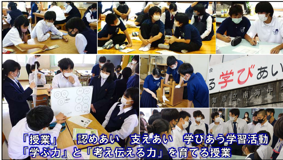
「授業」 認めあい 支えあい 学びあう学習活動 「学ぶ力」と「考え伝える力」を育てる授業