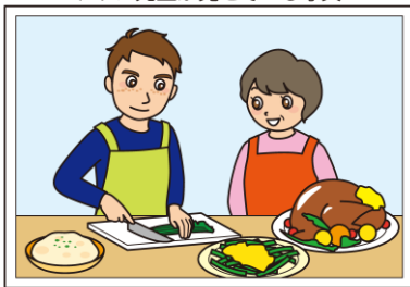
アラン先生が見せている写真