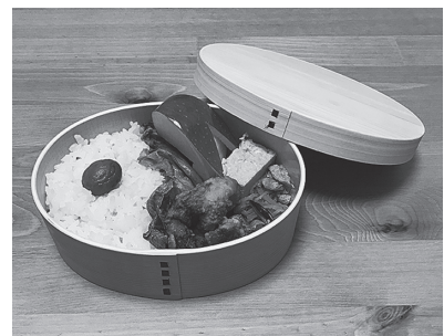
曲げわっぱの弁当