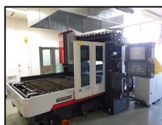
← 炭酸ガス二次元レーザー加工機