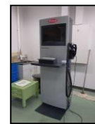
バーチャル溶接トレーニングシステム →

本校は昭和37年に開校し、本年61年目をむかえる工業高校である。機械・電子系の4学科に特化しており、マシニングセンタ・レーザ加工機・放電加工機・三次元CADなど、充実した施設設備を導入し、社会の変化に対応できる技術者養成を目指している。ものづくりを通じた人づくり教育を推進し、以下の経営ビジョン・教育スローガンを立て、学校の特徴化・魅力化を図っている。