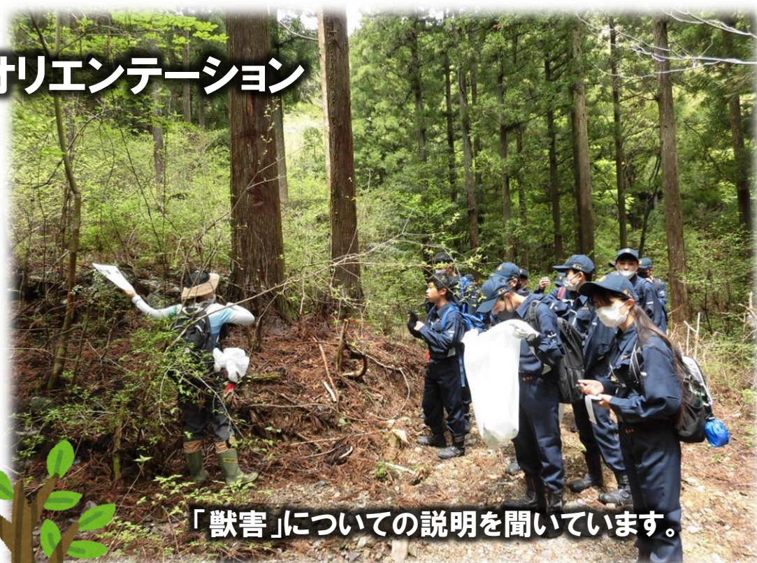
「獣害」についての説明を聞いています。