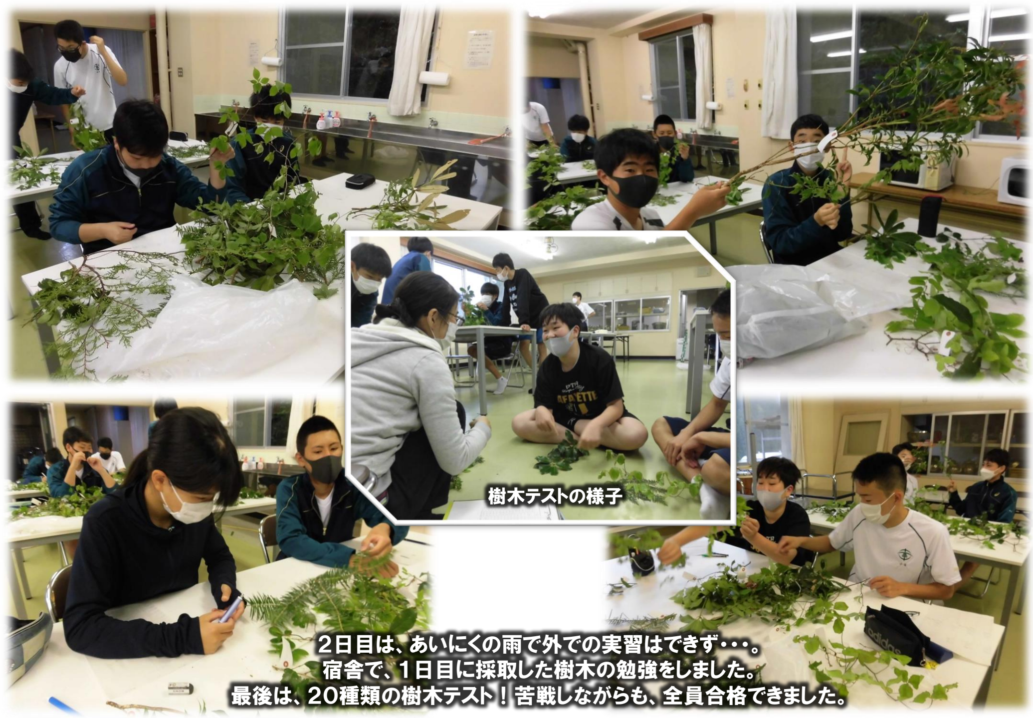
樹木テストの様子

2日目は、あいにくの雨で外での実習はできず…。 宿舎で、1日目に採取した樹木の勉強をしました。 最後は、20種類の樹木テスト！苦戦しながらも、全員合格できました。