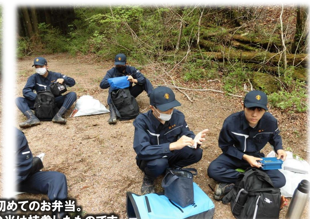
演習林で初めてのお弁当。 1日目なので、お弁当は持参したものです。