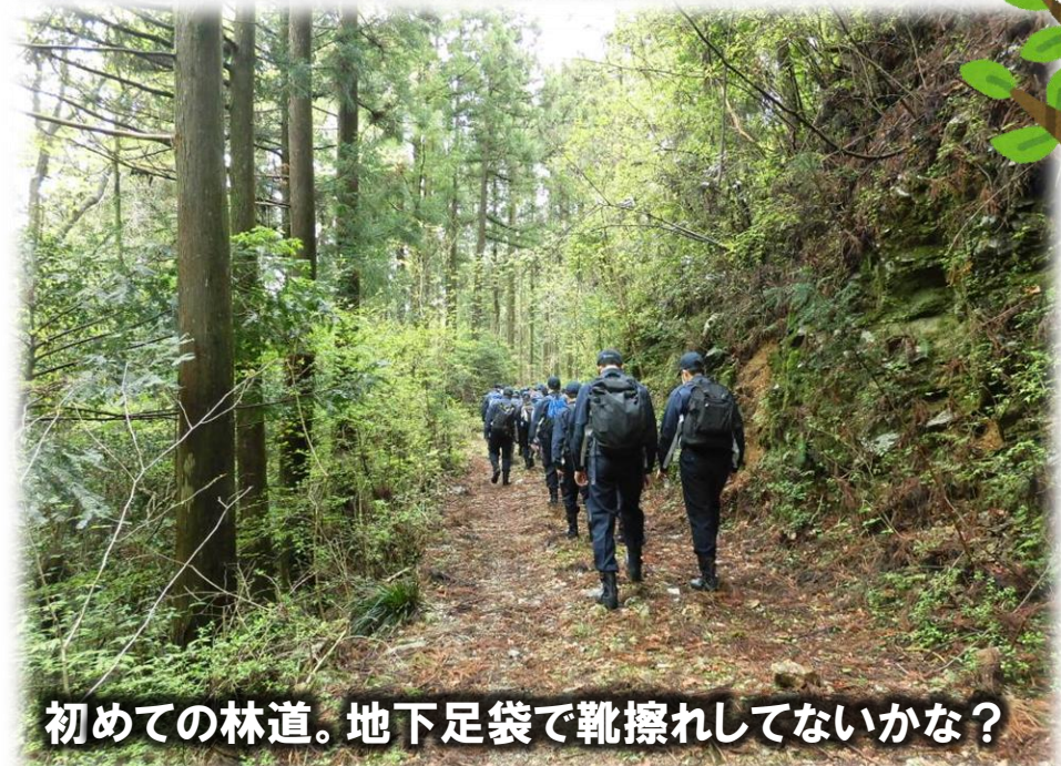
初めての林道。地下足袋で靴擦れしてないかな？