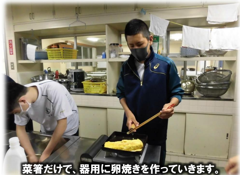
菜箸だけで、器用に卵焼きを作っていきます。