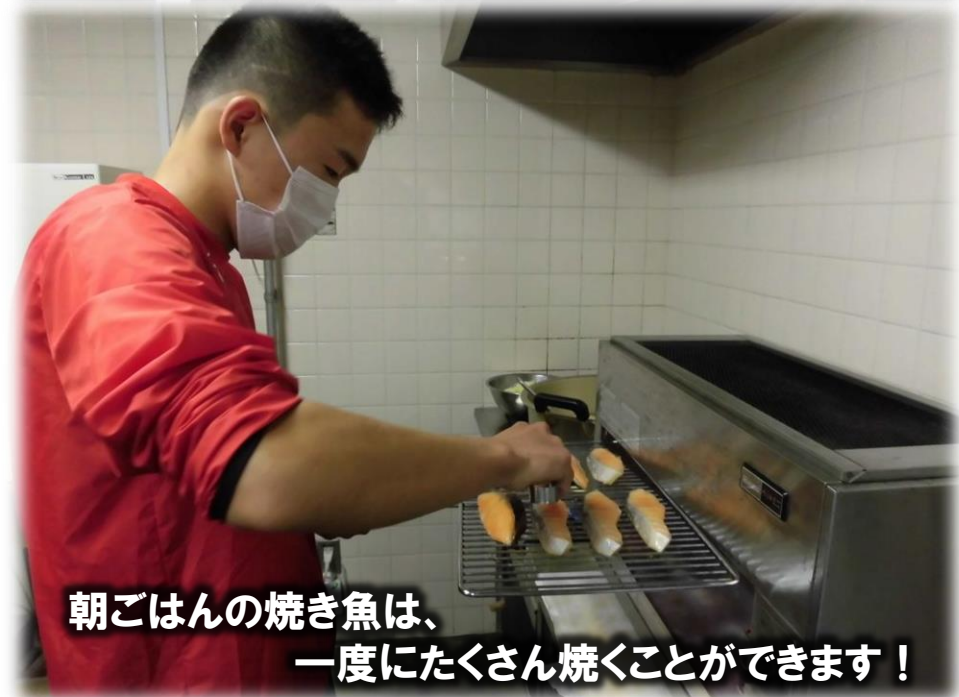
朝ごはんの焼き魚は、 一度にたくさん焼くことができます！