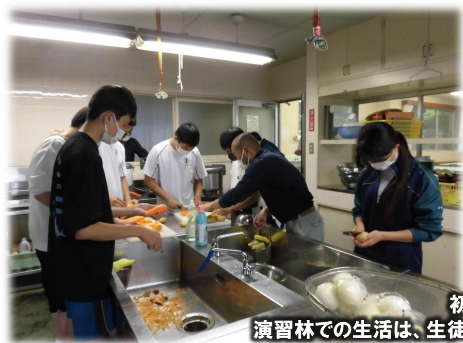
初めての食事当番。 演習林での生活は、生徒のみなさんの当番制で成り立っています。