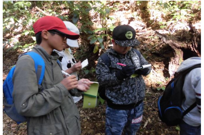
登山をしながらもメモを取る様子。さすが6年生！