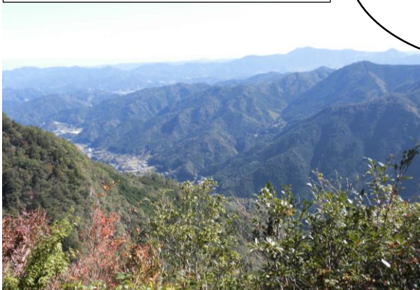
岩の先からの景色。普段自分たちが住んでいる越知町を一望することができ、怖い思いをしながらも行って良かったです。