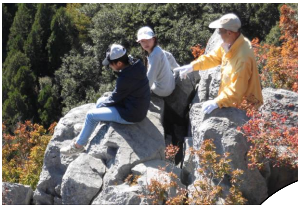
三つ尾委員の皆さんの力を借りながら、慎重に下りていく6年生。