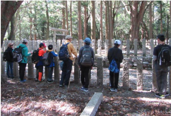
横倉山について初めて知る事も沢山ありました。

6年生の「横倉山登山」がありました。6年生は6グループに分かれ、それぞれの三つ尾委員さんの説明を聞きながら、横倉山を登っていきました。横倉山に登ったことはあっても、まだまだ知らない場所があったり、横倉山の歴史について知らないことがあったりする児童も多く、三つ尾委員の皆さんの説明を聞きながら登山をすることで、横倉山の良さを改めて感じることができました。特に馬鹿だめしは、「怖い、怖い。」と言いながらも岩の端っこまで行くと、そこから見える絶景に興奮する児童も多くいました。