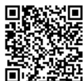
Facebook Q-R コード