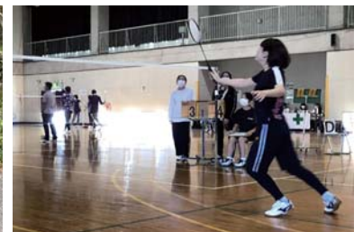
定通幡多支部体育大会