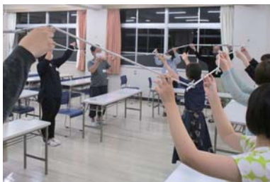
サポートステーションセミナー