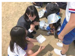
小中高合同防災交流会