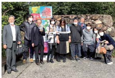
校外学習「牧野植物園」