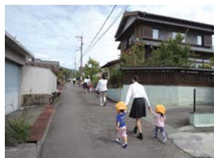
保小中高合同避難訓練