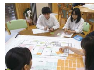
オリジナル HUG の実践