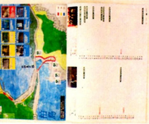
2023年度 防災カレンダー

つかり対応できるよ うにしたいという責 任感が湧いてきて防 災士にチャレンジし ました。これから、 災害への備えなど学 んだことを周りの人 たちに伝えていける ような防災士になれ るよう努力したいと