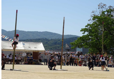
(1年ぶりのマスト登り復活)

十分な練習時間とはれていませんでしたが、後ままでの児童も最後まで諦めることなく頑張ることができたのは、援がみなさんの応援のおかげです。