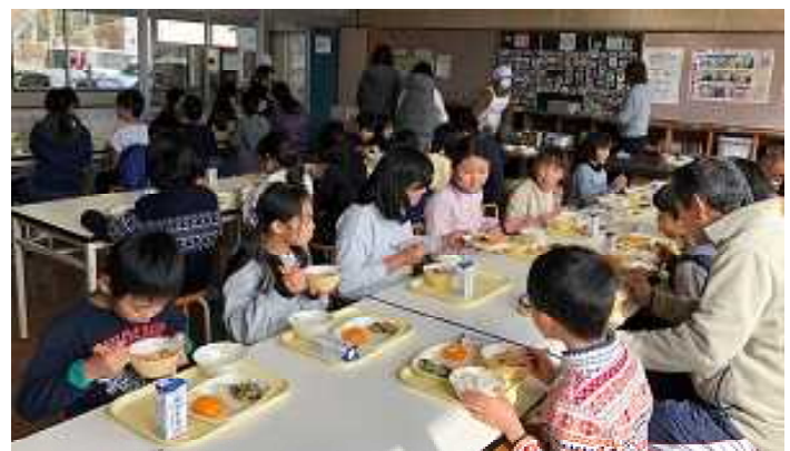
* 新しい席も決まり、早速給食の始まりです。

始業式では、一年の締めくくりをして欲しいことを話しました。短い期間の中で、これまで身につけてきたことをさらに伸ばしながら、次の学年へとつなげて欲しいと思っています。