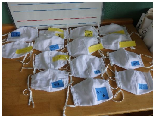
6年生が作ったマスクです。