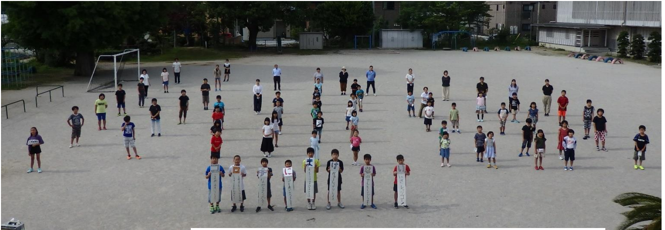
全校で写真を撮りました。2020高石小合言葉「コロナにまけない」