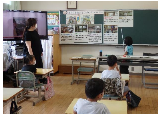
2年 じしんがおきた時どうすればよいのかな（学校編）

学年ごとに1時間防災学習も行いました。地震や津波だけでなく、大雨洪水・雷など自然災害が毎年のように日本でも起きています。家族の避難場所や連絡先、持ち出し袋や備蓄品など子どもさんと一緒に準備しておくといいですね。各家庭に配布されている「家庭版：南海地震に備えちよき」は県のホームページでいつでもダウンロードできますので参考にしてください。