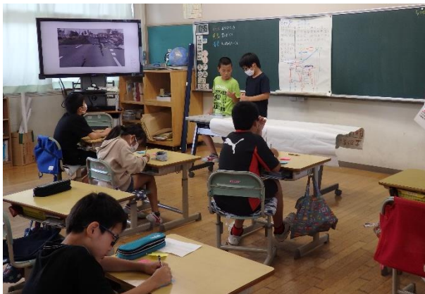
5年 防災について調べたことを発表しよう