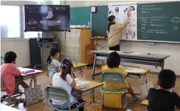
3年 家や町でじしんがおきたら