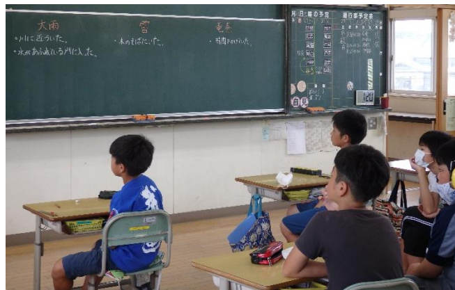
6年 大雨・雷・竜巻から身を守る