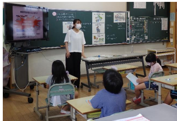
4年 どんな場所においても地震から身を守るには