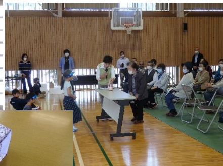
代表がプレゼントをもらいました。