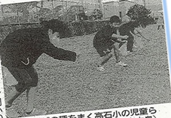
レンゲの種をまく高石小の児童ら (土佐市中島)

『土佐』きれいな花が咲く中で卒業や入学シーズンを迎えてもらおうと、土佐市高石地区の児童や園児、住民らがこのほど、同市中島の高石小学校に隣接する休耕田にレンゲの種をまいた。