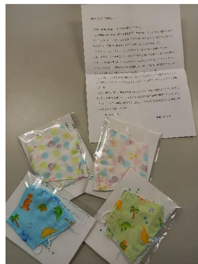
上が大きいサイズ、 下が小さいサイズです。

先日、高知新聞で、高石小学校でTシャツアート展が開催されたと、拝見しました。大変な時期でも、子どもたちの元気な姿が地域の励ましになります。これからも高石小学校の皆様のご活躍と、この大変な時期を皆さんが健康で乗り切れるように願っています。