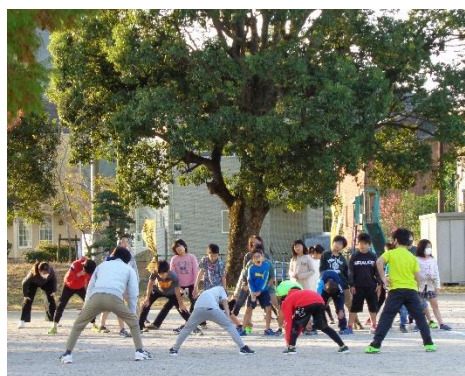
朝、走る前の準備運動（高学年）

はじめより楽に走れるようになった、去年よりたくさん走れるようになった、速くなったということを目指して、でもみんなで走ることと一緒に頑張れますね。みんなは毎年体も大きくなり、