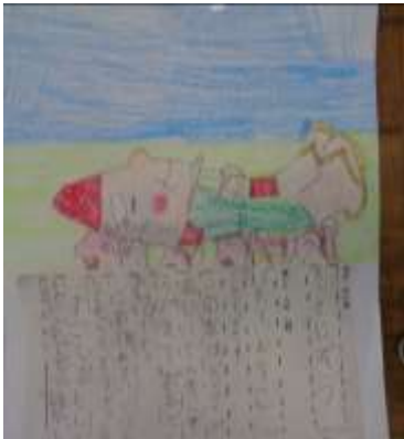
2年生の昔話紹介 長さの学習で身の回りのものの長さを表にまとめています。