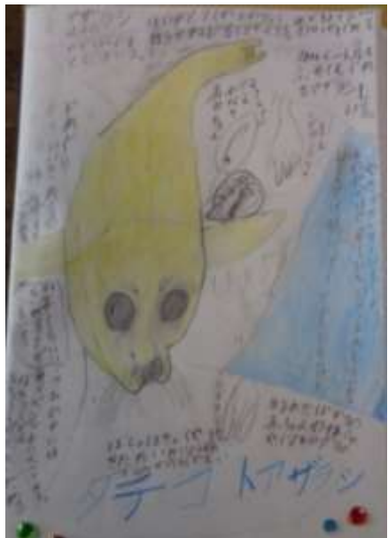
1年生の自由帳 本を見て調べて書いたそうです。絵も上手だけれど、周りに書いている説明もまるで自由研究のようです。