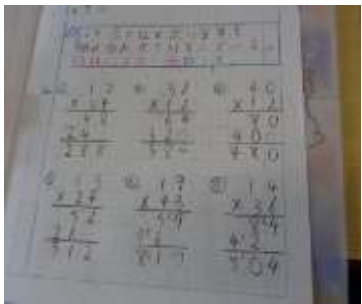
3年生の算数ノート かけ算のひっ算です。ノートのマスに合わせて1マス空けたり、1行空けたりしてとても見やすいです。