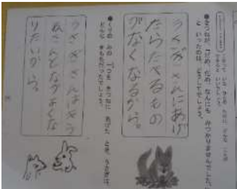
1年生の道徳のワークシート しっかりとした文字が書けるようになりました。

授業中のノートにも学習の成果や努力の積み重ねが見えてきています。授業中や休み時間に思わずカメラに取ったノートや絵を紹介します。