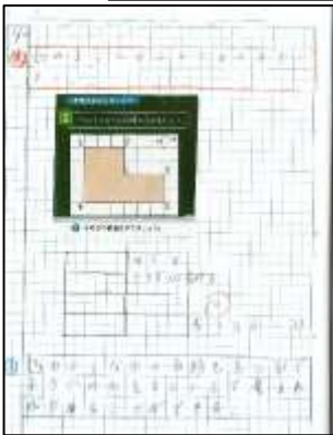
4年生の算数ノート 面積の求め方の学習で、自分の考えを図にかいて表しています。