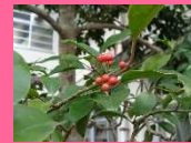
クロガネモチの赤い実