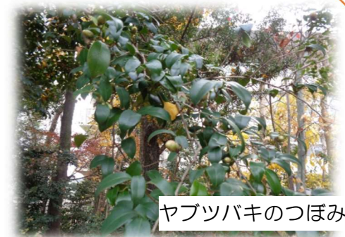
ヤブツバキのつぼみ