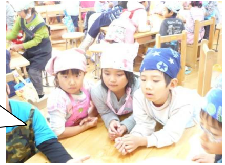
・アルミホイルのお皿にのせるよ・