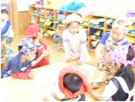
・一緒にまぜて・