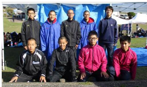
《高新中学校駅伝競走大会(女子の部)》春野運動公園