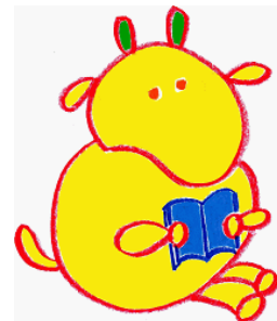
ヨモークン 土佐町国語力向上 イメージキャラクター