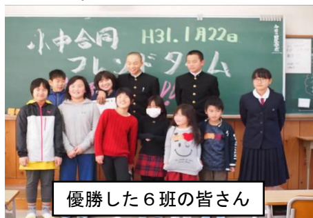
優勝した6班の皆さん