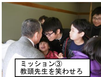
ミッション③ 教頭先生を笑わせろ