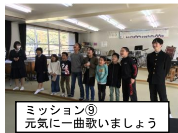
ミッション⑨ 元気に一曲歌いましょう