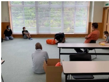
連絡員救命救急法講習のようす