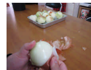
涙をためての皮むき