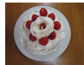
手作りケーキ完成