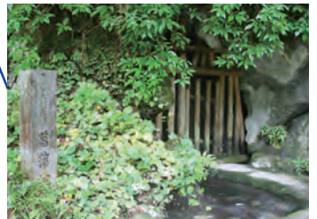
菟浦地区にある鍾乳洞で県指定の天然記念物 です。洞内には、様々な鍾乳石や石筍が自然 のまま残されています。