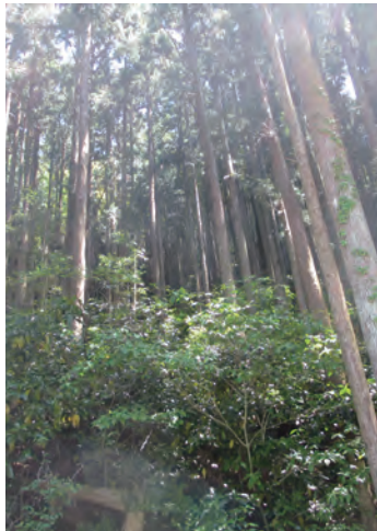
大部分が森林で占められている土佐山では、 一年を通してきれいな水、おいしい空気が味 わえます。