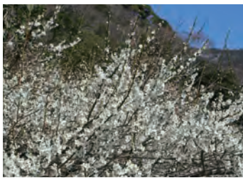
昔嫁入り途中の花嫁が休息のために座ったとい う石。春には見事な梅林が花を咲かせ「梅 まつり」が行われます。