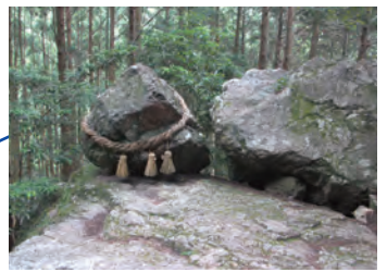
岩の上に乗った大きな石。子どもの力でも、 押しとゴトゴトと揺れるのに、落ちそうで決 して落ちない不思議な石。合格祈願に最適。