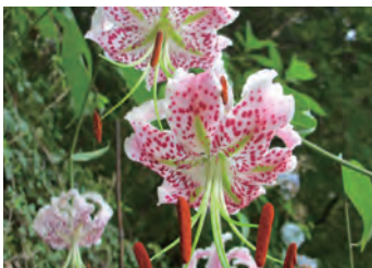
絶滅危惧種「たきゆり」が自生する国内の数 少ない地域です。見頃は7月中旬ごろ。地域 のあちこちで可憐な花が咲きます。