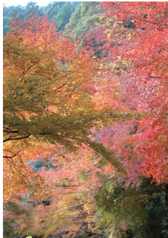
工石山一帯は紅葉のスポットです。朝夕の冷 え込みが激しくなる11月中旬になると、山が 真っ赤に色づきます。