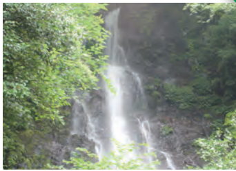
名前の由来は滝の中程に祀られた山姥様。落 差は30mの滝のすぐ近くまで行くことがで きます。