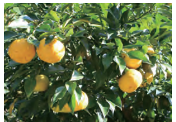
土佐山はユズの一大産地。ユズの加工品もた くさんあります。晩秋の土佐山にほのかなユ ズの香りが漂います。