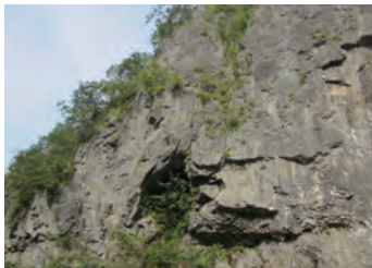
鏡川の川岸にそびえる絶壁に、直径5m程の 大穴が開いています。辺りは水遊びの絶好の スポットになっています。