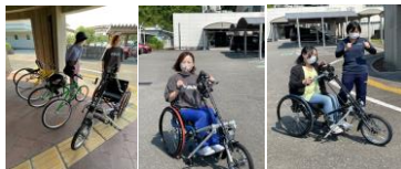
【高知若草特別支援学校】

7月22日(土)に開催予定の親子行事の打ち合わせに保護者3名が参加しました。場所は、障害者スポーツセンター。親子で楽しめるように事前体験も行ってきました。