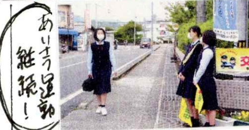
あいらずの運動 継続!