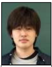
最近ピアノにハマってます！

① 1・2年生ともに、自分の考えをもって発言ができていてよかったです。 ② 2年生と、テーマについての話をし、内容の深掘りができました。テーマを決めるサポートや、もちろん内容の手助けもしていきたいです。