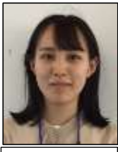
生物、料理、茶道が好きです！