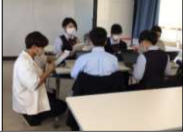
たくさん話げできました★