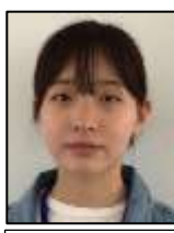
りんごジュースが好きです

① いろんなテーマがあったて楽しかったです。 ② テーマと実験の進め方について話しました。 ③ 高校生の時にどう進め