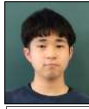
趣味は、映画鑑賞です

① みんなにぎやかで、話しかけても明るく対応してくれる易しい生徒たちでした。 ② 主に2年生と、今考えているテーマや進み具合などについて話をしました。 ③ 自分の得意なテーマがピンポイントであるわけではなかったですが、知識をフルに使ってサポートしていきたいと思います。