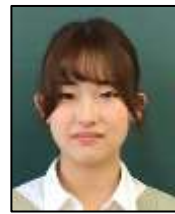
漫画と配信者さんが好きです！

① 3年前の自分たちを思い出して、とても苦しかったです(笑)今のうちに、失敗を経験しておいてほしいです。 ② とにかく早く仮説を決めたほうがいいよとアドバイスしました。自分が1年生だった時の経験からのアドバイスです。 ③ アンケートの作り方や、人とのつながり方など、経験を踏まえてサポートしていけたらと思います。