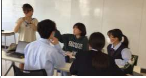
1期生と4期生、夢の(?)競演

前回に引き続き、今年度授業に参加してくれる高知工科大学のサポーターの紹介をします。サポーターの皆さんには、参加初日の感想を聞いてみましたので、紙面にて共有します。生徒のみなさんがサポーターの顔と名前を早く覚えて、交流するきっかけになればいいなと思っています。 なお、サポーターへの質問はすべて同じで、 ① 授業参加の感想 ② 今日生徒と話した内容 ③ 今後の意気込み の3つでした。