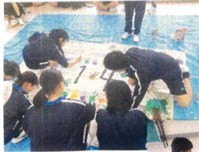
←クラスの旗づくり☆

宿泊研修を通して、普段体験することが出来ない事も体験することが出来ました。そしてクラスの団結力もupしたと思います。普段見る事が出来ないような友達の良い所を沢山発見出来ました。クラス・学年でまだ改善しないといけない事は沢山ありますが、この1年「笑顔があふれるクラス・学年」にみんなですていきたいと思います。