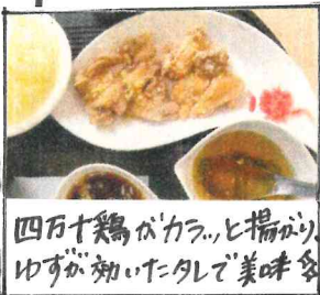
四万十鶏がカラッと揚がり、ゆずが効いたタレで美味多

3月18日~4月21日、ビジネス探究科2年生チームが考案した「土佐の油淋鶏」と「山高生のニラ豚のシャモックそば〜お焼き風味愛情仕立て〜」が高知自動車道南国SA(上下線)で販売されました。