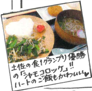
土佐の食(クランチ)優勝の「シャモックそば」!! ハートのご飯もかわい!

この活動を通して学んだことは、メニューを考案する上で若者目線などいろいろな視点で考えることが重要だし、年齢層にあったニーズを知ることが大切だということです。南国サービスエリアさんとコラボした、高知の特産品をたくさん使ったお食事となりました。