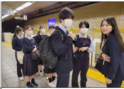
移動はすべて電車でした！楽しかった！

感動したあとは上野へ。ここでは上野動物園を見る生徒、国立西洋美術館を見る生徒と、思い思いに時間を過ごしました。その後は有明に移動し、普通科と合流して劇団四季のミュージカル「ライオンキング」を鑑賞しました。G探の生徒に修学旅行の感想を聞くと、多くの生徒がライオンキングの感動を挙げます。そのくらい、深く心に