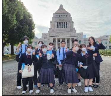
国会議事堂も見学しました

れた明治期の新聞や、昭和30年代の漫画本、自分たちが読んでいた少女漫画など貴重な資料を見せていただき、全員大興奮でした。 午後からは国会議事堂と国立近代美術館を見学しました。議事堂の質実剛健で荘厳な建築に圧倒され、美術館の企画展(フエミニズム展でした)で考えを深めました。 2日目の午前中は、東京駅の見学と上野恩賜公園散策です。今回、移動にはすべて電車を使用したのですが、東京駅の人の多さと流れの速さは驚きでした！ たった9名しかいないのに途中ではぐれるほど続々と人波が押し寄せていました。改札を出て、高層ビルとレトロな駅舎の対比に