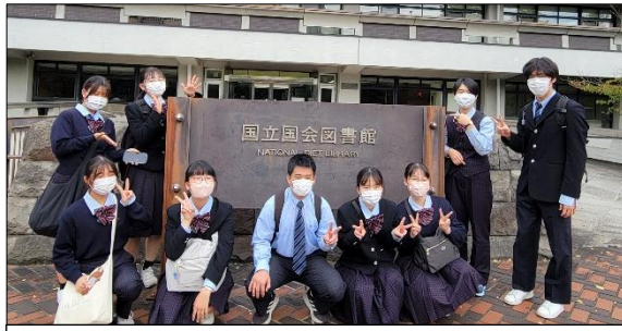
国立国会図書館は、地上は4F、地下は8Fまであります